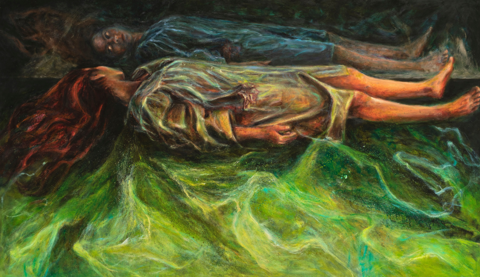
La traversée, 2023-2024., technique mixte sur toile, 195 x 114 cm