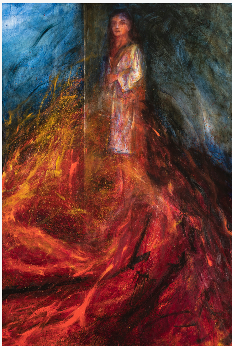
La dame des laves, 2023, Huile et pigments sur toile 162 x 114 cm